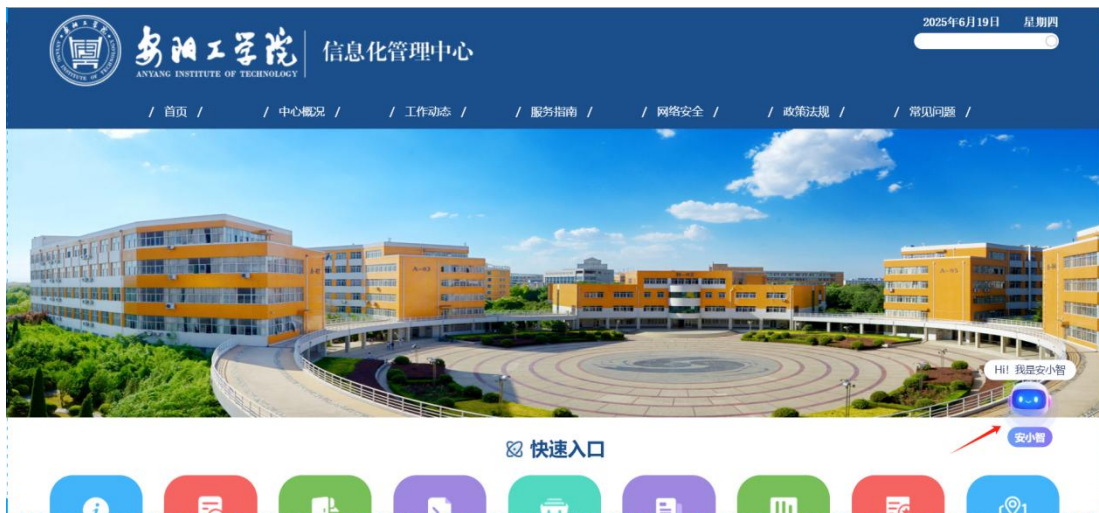
(安小智信息化管理中心登录位置展示)