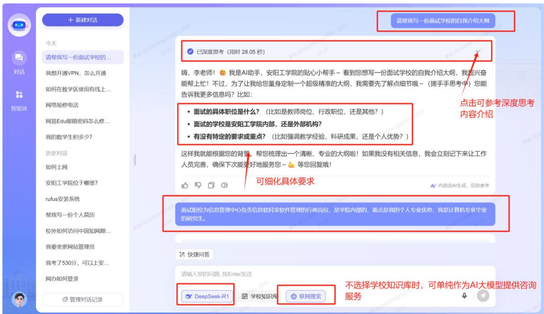
不选择学校知识库时, 可单纯作为AI大模型提供咨询服务