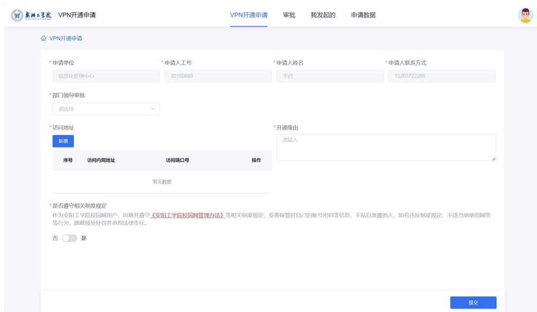
(PC 端咨询界面-流程应用咨询，流程入口推送点击直接办理界面展示)