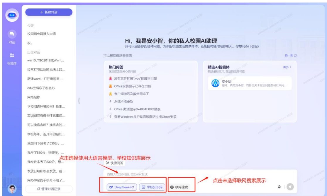
(PC 端咨询界面-大语言模型、学校知识库、联网搜索选择界面展示)