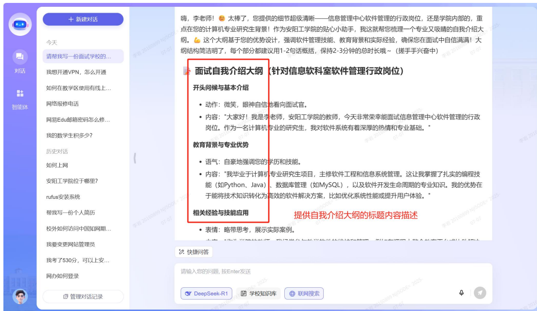
(PC 端咨询界面-单纯作为 AI 大模型进行咨询服务界面展示)

注：学校移动端钉钉入口、信息化管理中心网站入口以及网上办事大厅网站入口，支持的网络信息服务咨询以及作为单纯的 AI 大模型咨询服务与以上介绍的 PC 端服务咨询使用完全一致。