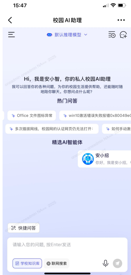
(钉钉上安小智登录成功后界面)