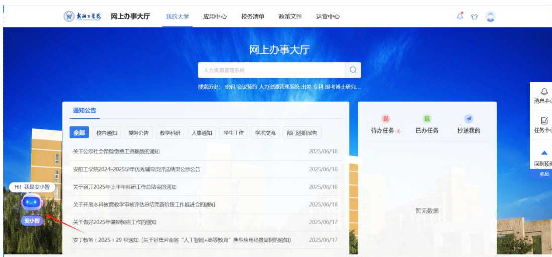
(安小智网上办事大厅登录位置展示)