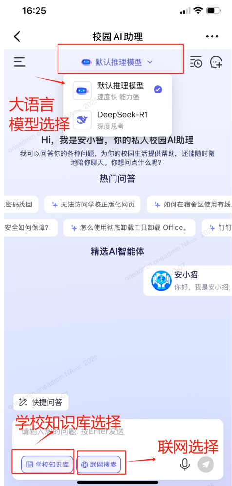
(钉钉咨询界面-大语言模型、学校知识库、联网搜索选择界面展示)