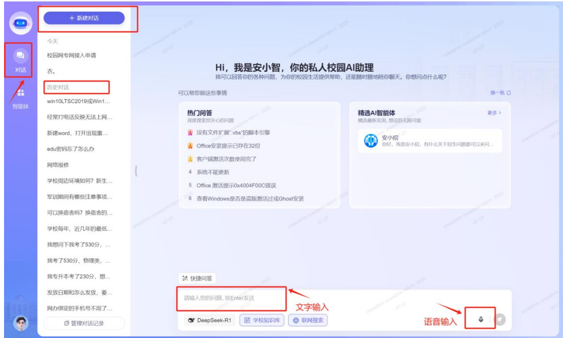
(PC 端咨询界面-对话文字输入、语音输入界面展示)

1、PC 端支持输入文字和语音咨询，支持查看历史对话记录，支持自主选择大语言模型、学校知识库、联网搜索来进行回答，支持快捷问答等。