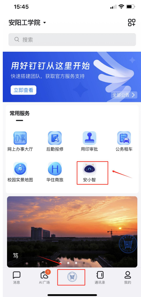
(钉钉上从工作台，找到安小智界面)