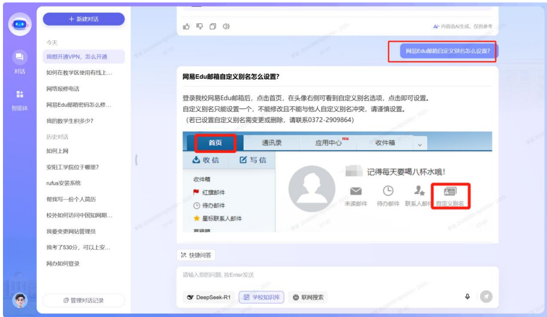
(PC 端咨询界面-通过点击快捷问答、点击热门问题直接咨询界面展示)