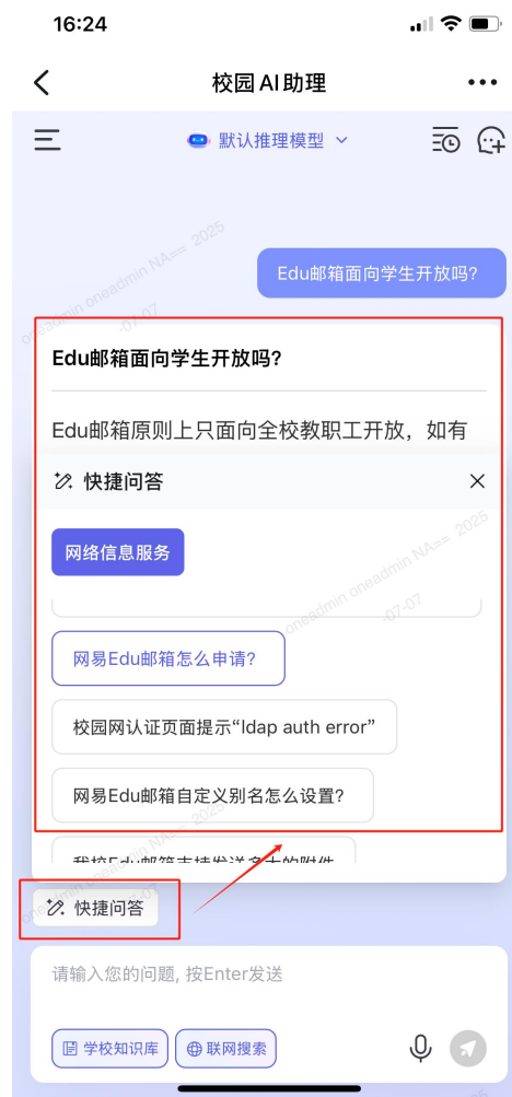
(钉钉快捷问答界面展示)