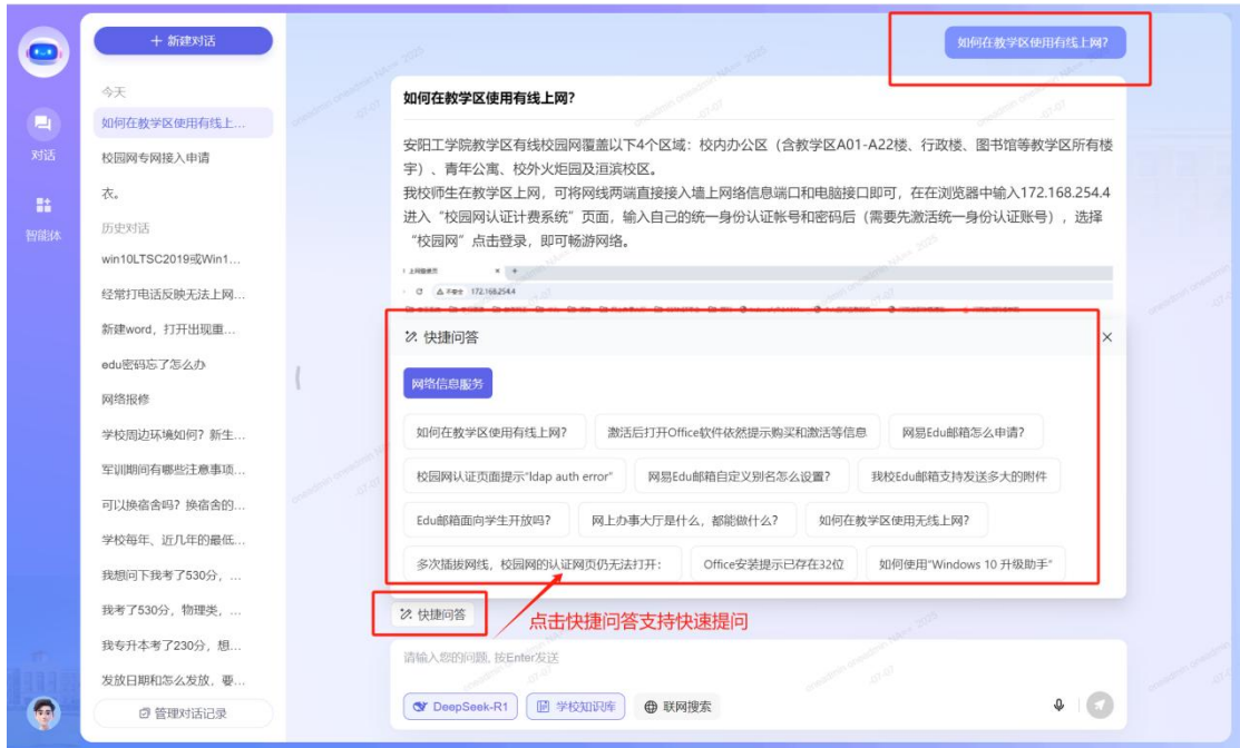
(PC 端咨询界面-快捷问答界面展示)

2、移动端钉钉支持输入文字和语音咨询，支持查看历史对话记录，支持自主选择大语言模型、学校知识库、联网搜索来进行回答，支持快捷问答等。