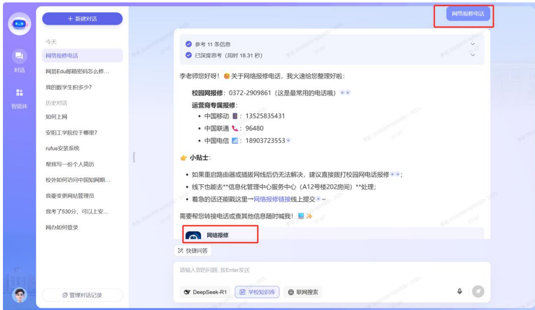
(PC 端咨询界面-规章制度咨询、事项办理咨询界面展示)

2、支持在咨询流程应用申请相关问题，支持将对应流程应用地址入口直接进行推送，然后用户点击可直接跳转到对应流程进行办理。